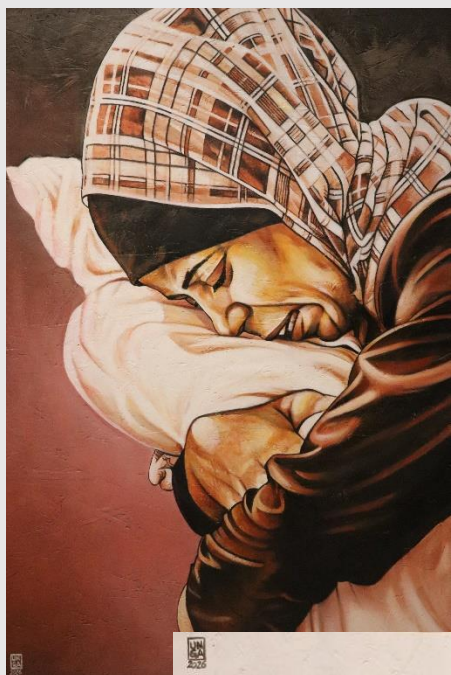
XII Stazione – Gesù muore sulla croce