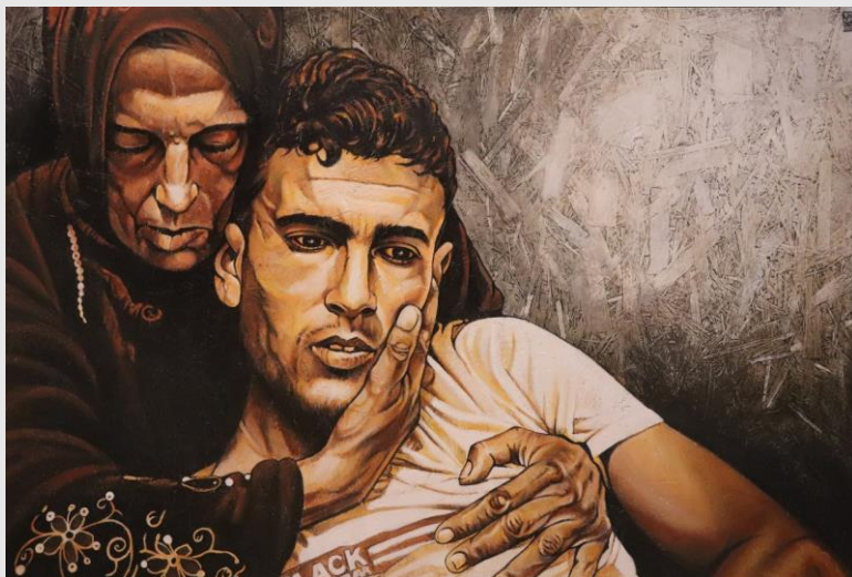
V Stazione – Gesù è aiutato dal Cireneo