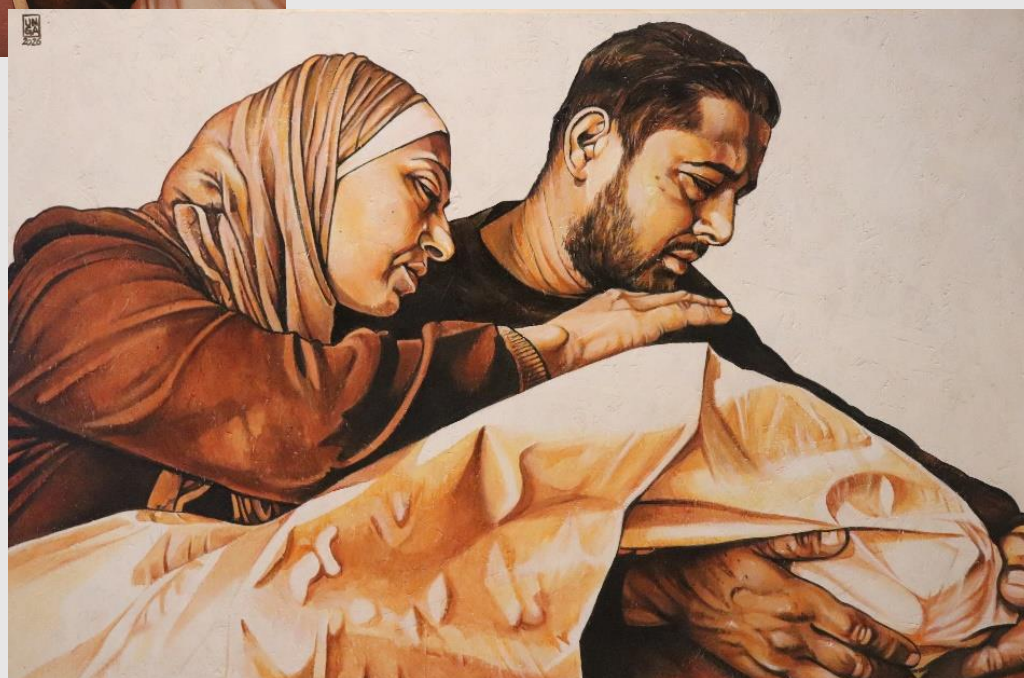
XIV Stazione – Gesù è deposto nel sepolcro

"In questa Via Crucis manca volutamente la stazione della Resurrezione . A Gaza restiamo nel buio di un Sabato Santo che sembra non finire mai , dove Dio muore sotto un bombardamento notturno.