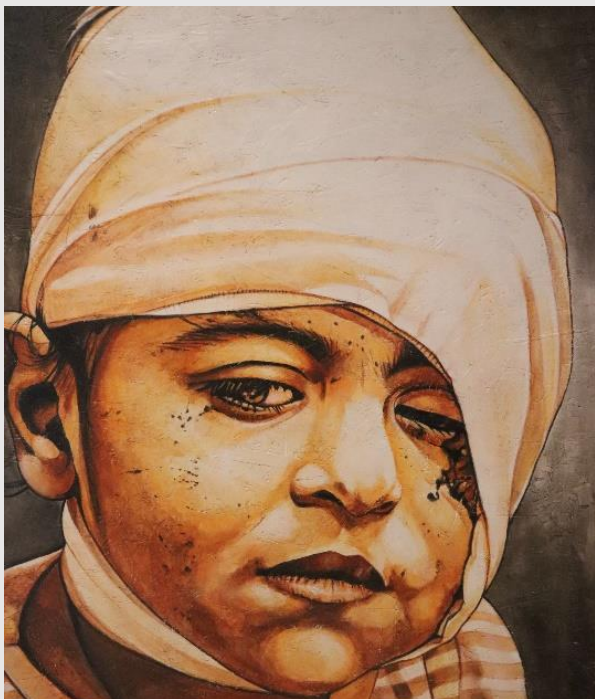
VI Stazione – La Veronica asciuga il volto di Gesù