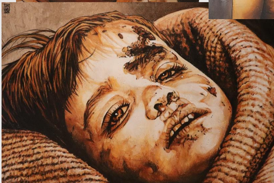
VII Stazione – Gesù cade per la seconda volta

"Cerco una bellezza che sia ' medicina amara ': un'esca visiva per costringere lo sguardo a restare lì, fermo, a misurarsi con una verità che altrimenti rigetteremmo. Davanti a questi pannelli, molti dicono: 'È bellissimo'. È un paradosso lacerante. Cosa c'è di bello negli occhi di un bambino che ha subito l'orrore? Nulla. Eppure, quel 'bello' è l'involucro necessario che ci permette di non scappare davanti alla ferocia della realtà."