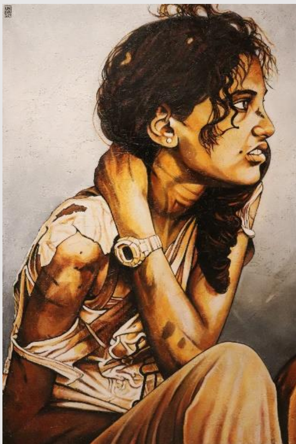
III Stazione – Gesù cade per la prima volta