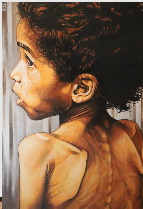
X Stazione – Gesù è spogliato delle sue vesti