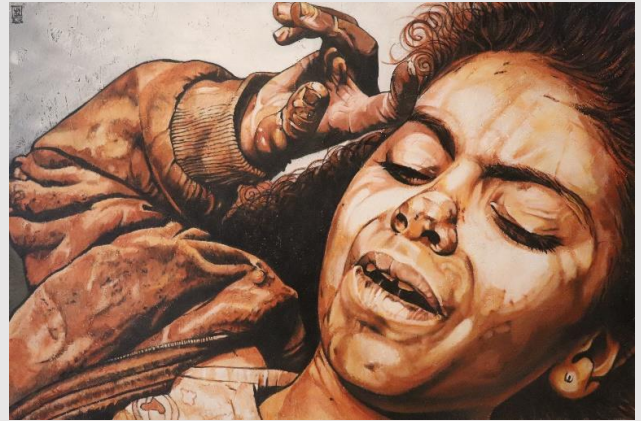
IX Stazione – Gesù cade per la terza volta