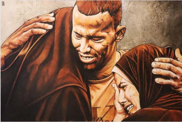
VIII Stazione – Gesù incontra le donne di Gerusalemme